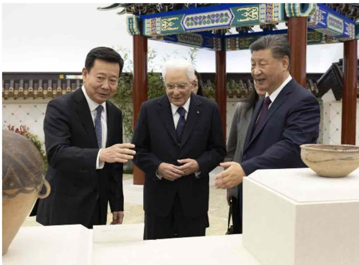
Il presidente Sergio Mattarella (al centro) con l'omologo cinese Xi Jinping (a destra)

Ritaglio stampa ad uso esclusivo del destinatario, non riproducibile.